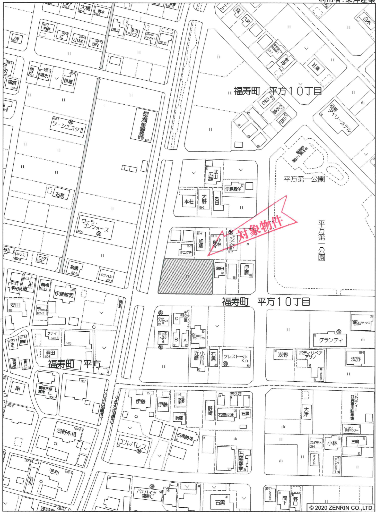
羽島市福寿町 平方10丁目付近